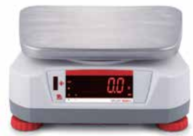
Rückwärtiges Display mit integriertem berührungslosen Sensor